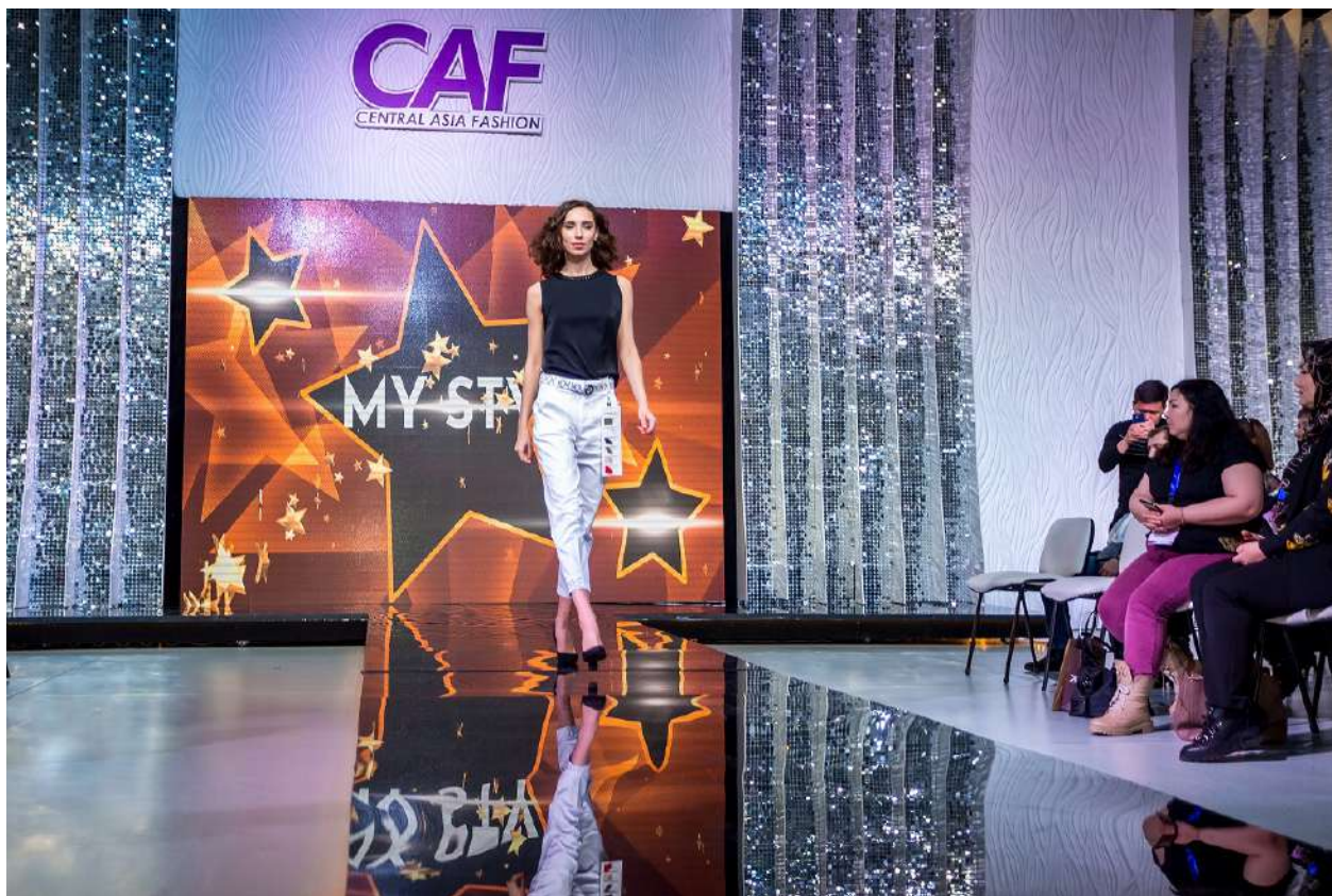
Модные показы участников выставки CAF Spring-2022

Участники международной выставки моды CAF Spring-2022 привезли в Алматы новые коллекции на грядущий сезон для предзаказа и закупа байерами и обменялись информацией о положении индустрии. В зоне show area, на специально оборудованном подиуме представили свои новые коллекции 16 модных брендов из Турции, России и Индии.