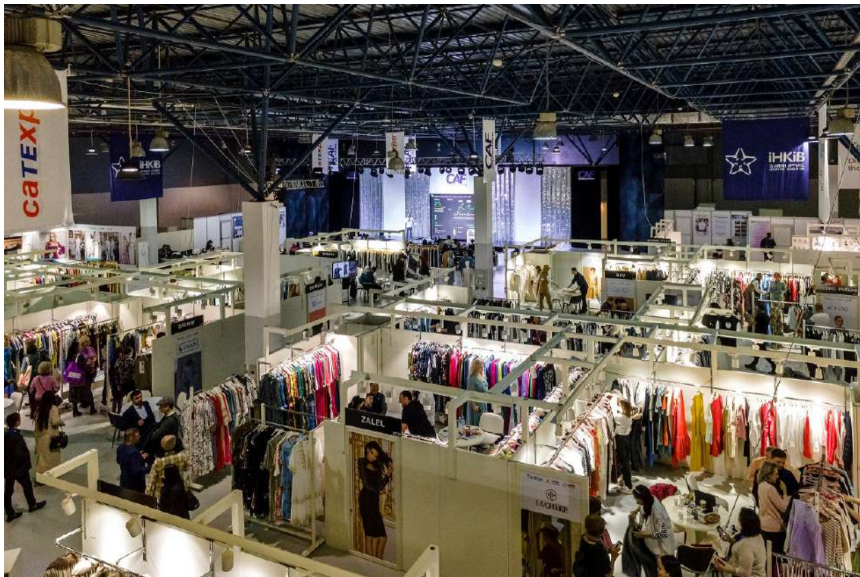
Стенды участников CAF Spring 2022

детская одежда, головные уборы, верхняя одежда и шубы, спортивная и джинсовая одежда, нижнее белье, а также сумки и модные аксессуары.