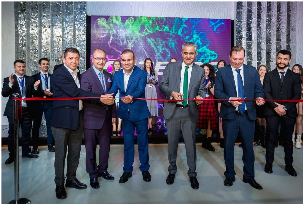
Церемония открытия Central Asia Fashion Spring-2022 и ее почетные гости

В Алматы с 14 по 16 марта 2022 года состоялась крупнейшая профессиональная международная выставка моды в центрально-азиатском регионе – Central Asia Fashion Spring-2022. Очередной, 29-й сезон мероприятия посетили 4516 профессиональных специалистов fashion индустрии: байеры, собственники и владельцы бизнеса, торговые представители, дистрибьюторы, директора магазинов, оптовые продавцы, поставщики, аналитики, представители торговых центров и эксперты модного рынка. Специальной байерской программой, открытой для поддержки бизнеса организаторами мероприятия-выставочной компанией CATEXPO, воспользовались 786 предпринимателей из всех регионов Казахстана. Помимо этого весенний салон CAF посетили профильные fashion специалисты из Кыргызстана, Таджикистана и Узбекистана.